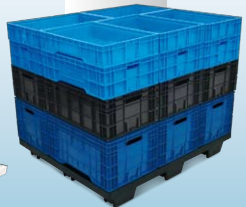
linha de caixas paletizáveis