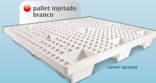
pallet injetado branco