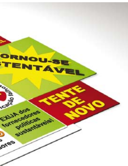
Tabuleiro mostra como Iveco, Kimberly-Clark e Walmart inseriram seus fornecedores no crescimento sustentável

que mudanças sejam adotadas, nada acontecerá. O equilíbrio neste caso é o melhor caminho.